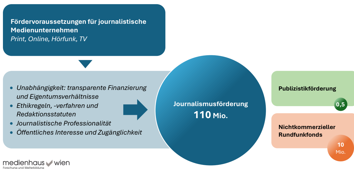
Abbildung ES-1: Journalismusförderung für alle Medientypen: Qualitätskriterien als Voraussetzung.

Außerhalb dieses einen umfassenden, marktorientierten Journalismusförderprogrammes und seiner Qualitätssicherung werden zudem die digitale Transformation der Anbieter von nichtkommerziellen, freien Rundfunkprogrammen und der Infrastrukturaufbau für gemeinwohlorientierte journalistische Projekte unterstützt. Dafür wird empfohlen, den Nichtkommerziellen Rundfunkfonds von derzeit 6,25 Millionen Euro auf 10 Millionen Euro zu erhöhen. Die gering dotierte Publizistikförderung soll erhalten bleiben, aber ebenfalls entbürokratisiert werden. Das Budget dafür wird mit rund 0,5 Millionen Euro vorgesehen.